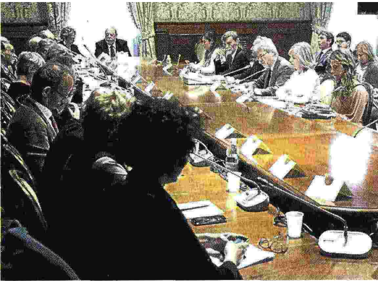
IL TAVOLO A Palazzo Chigi, con governo e 15 sigle sindacali