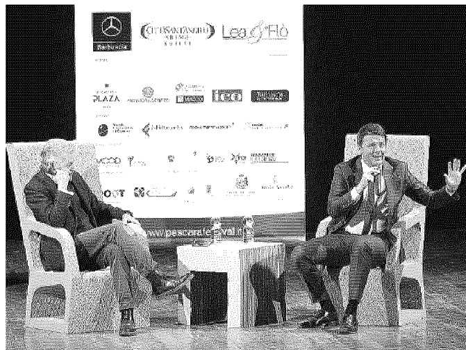
L'intervista Matteo Renzi sul palco di Pescara con Luca Sofri