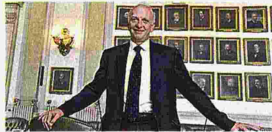
SVOLTA Il ministro dell'Istruzione, Marco Bussetti

Due prove scritte invece di tre, oltre all'orale con tre buste in cui i maturandi potranno essere interrogati anche sulla Costituzione. Più attenzione al percorso svolto dai ragazzi nell'ultimo triennio, con un punteggio maggiore assegnato al credito scolastico. Sono alcune delle novità introdotte dal nuovo esame che debutterà il 19 giugno.