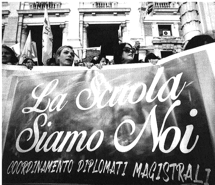
Roma, manifestazione degli insegnanti delle scuole pubbliche

Anziché spingere sulla formazione culturale, il governo la riduce a un apprendistato utile alle imprese