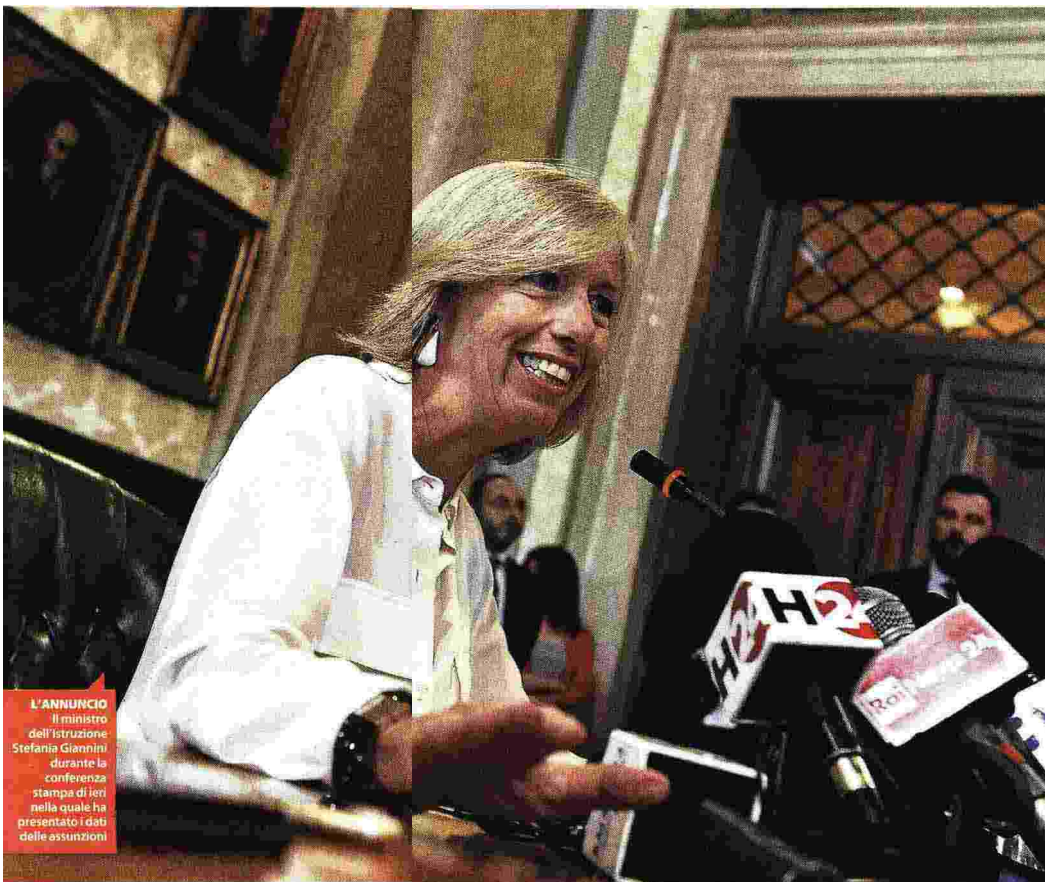
L'ANNUNCIO Il ministro dell'Istruzione Stefania Giannini durante la conferenza stampa di ieri nella quale ha presentato i dati delle assunzioni